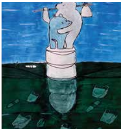
기후위기로 조각 얼음을 타고 피난 가는 엄마와 아기 북극곰(고등 1년)

지난 11월 말, 양곤 초·중·고 학생과 보육원생을 위한 미술대회를 열었습니다. 504명이 응모했는데, 이중 60명을 뽑아 그리기 대회를 가진 후 38명에게 시상했습니다. 미얀마에서 5년 만에 열린 이번 학생 미술대회는 저명 화가들이 심사를 맡아주어 호응이 컸습니다. 상을 받은 작품 2점을 소개합니다.