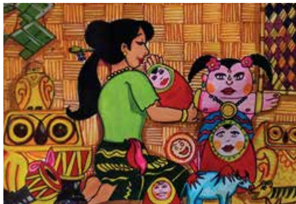
미얀마의 전통 색상을 살린 작품(초등 6년)